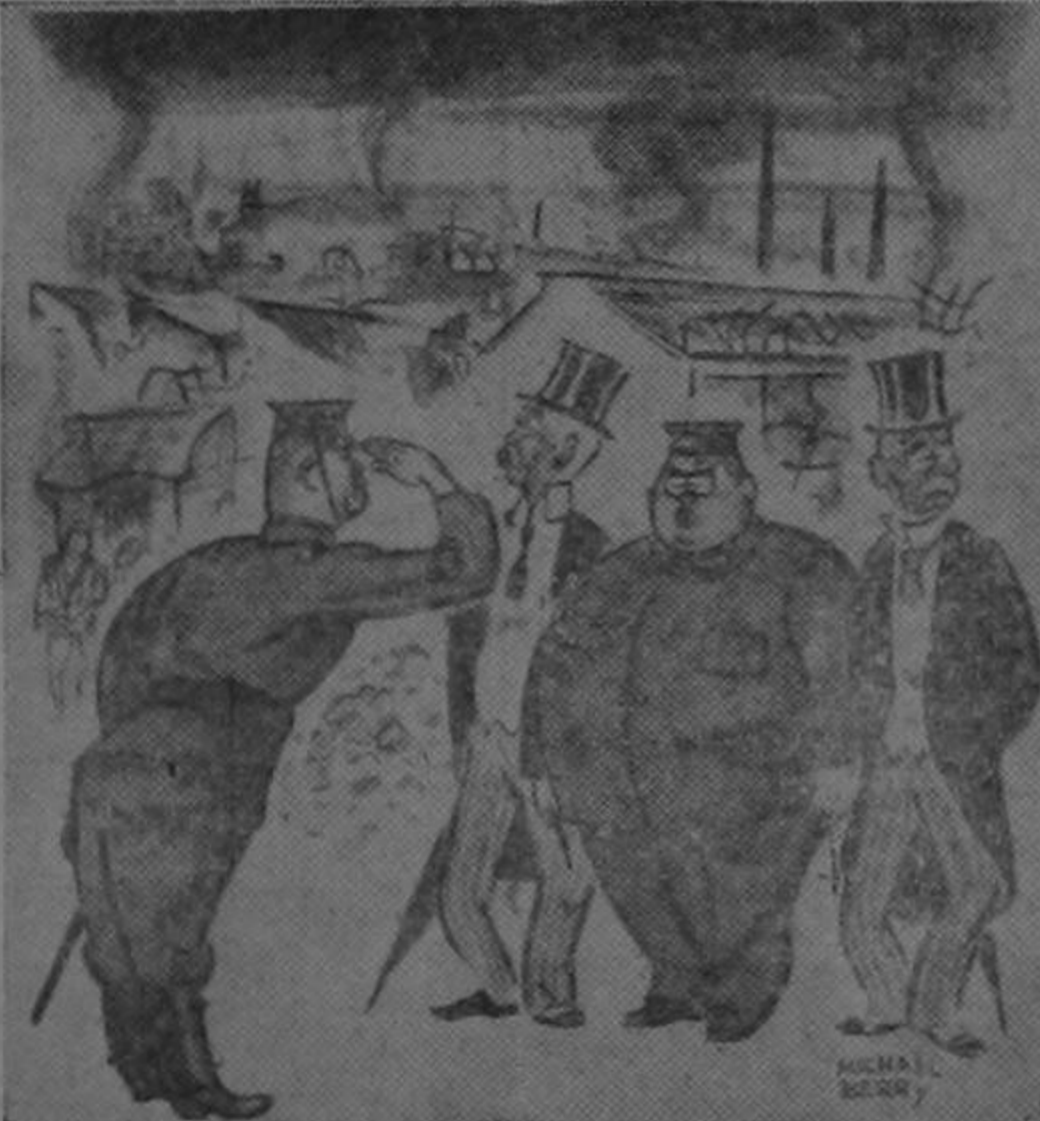
"Esos aviones enemigos lograron escapar, mi Coronel, pero todas sus bombas quedaron destruidas en tierra..."

Y que conste, a nosotros no nos preocupa que el canciller viaje de un lado para el otro. Al contrario, mucho nos alegra. Para el país es muy provechoso que su canciller viaje mucho, pero mucho. Quizás por aquello de que viajando se aprende bastante.