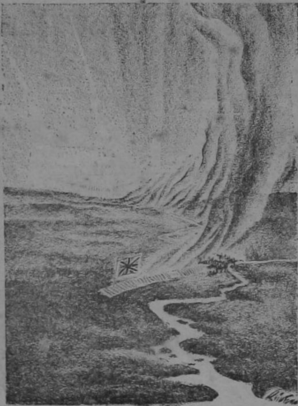
CAMINO DE MANDALAY

El Presidente se mostró compla- do y satisfecho de ver al pabellón cubano luciendo orgullosamente en una aeronave de ese tipo, considera- da como la más moderna y uno de los transportes comerciales más avanza- dos actualmente en servicio público. Al dis- poner ahora la Cia. Cubana de Avia- ción de dos aeronaves Douglas DC C-A, se han colocado a la altura de las más progresistas empresas aéreas de América, pero no satisfecho con el gran paso de adelante que acaba de realizar abreva propósitos más am- plios para un futuro cercano con cu- vos planes el público y el comercio cubano recibirán más servicios y más facilidades.