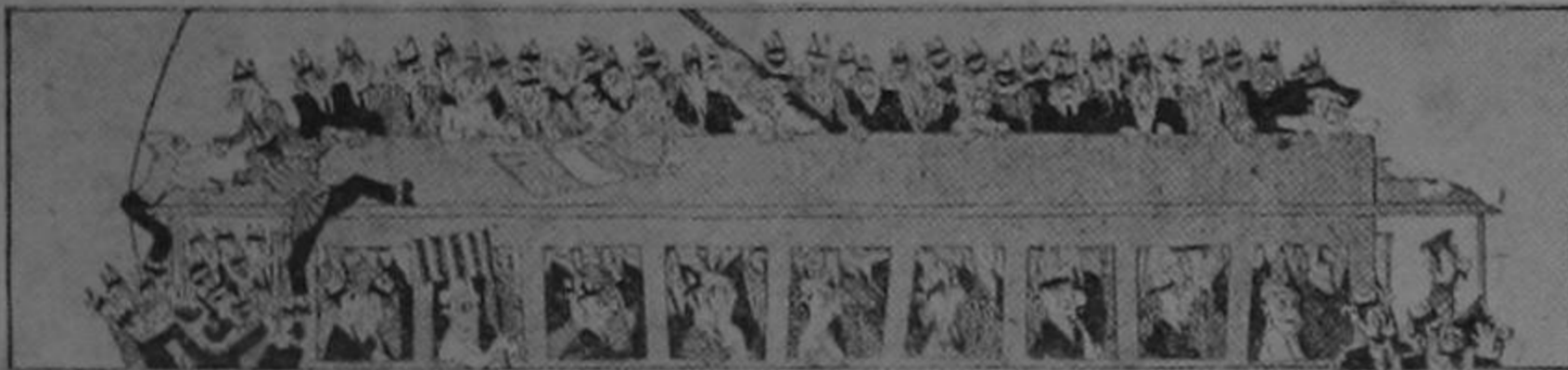
El Tranvía de las Once